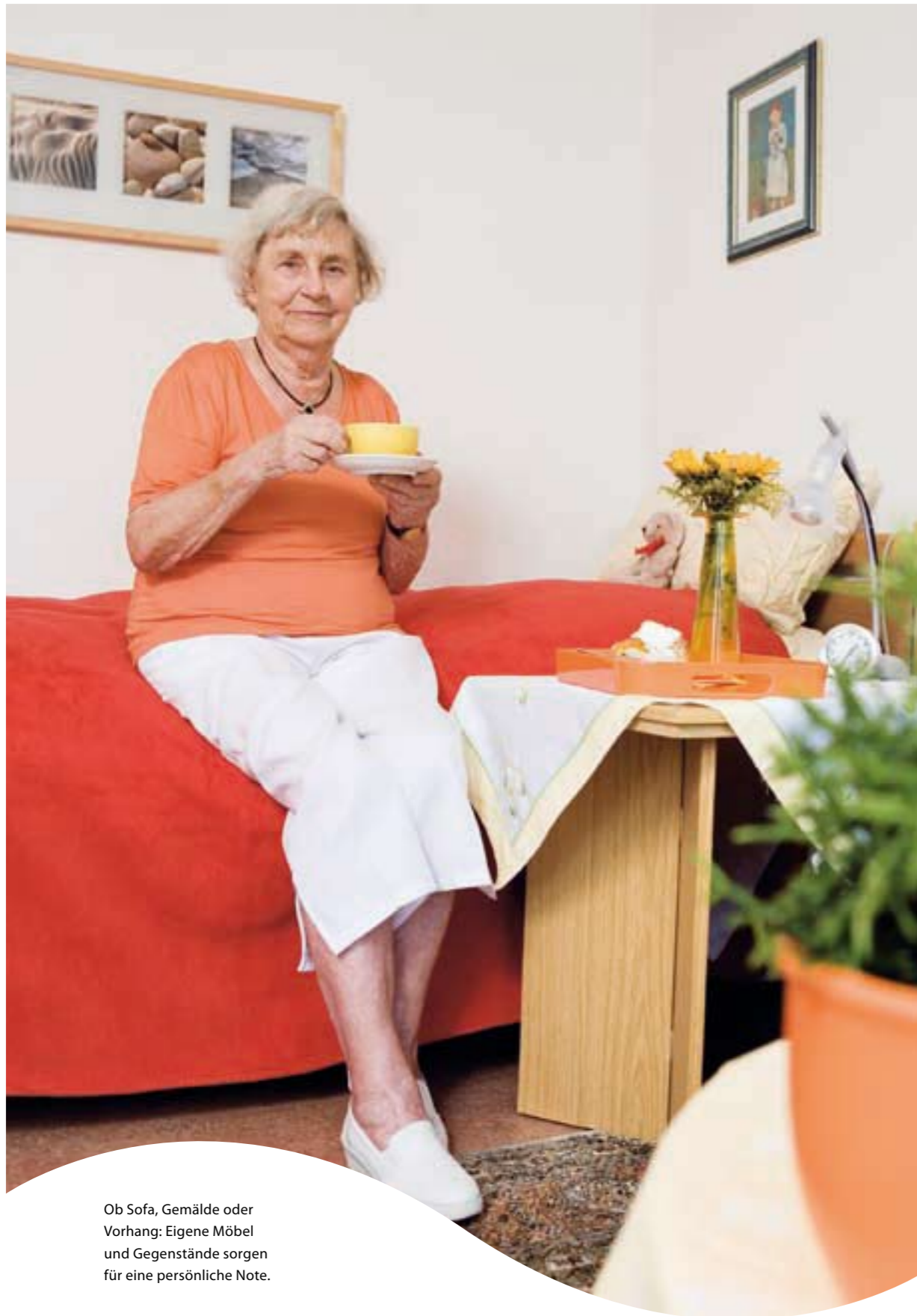
Ob Sofa, Gemälde oder Vorhang: Eigene Möbel und Gegenstände sorgen für eine persönliche Note.