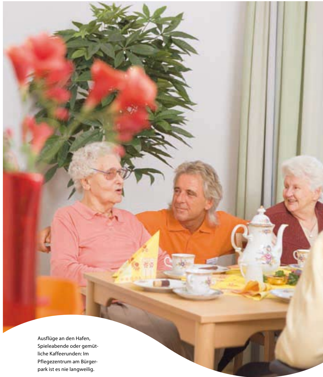
Ausflüge an den Hafen, Spieleabende oder gemütliche Kaffeerunden: Im Pflegezentrum am Bürger- park ist es nie langweilig.